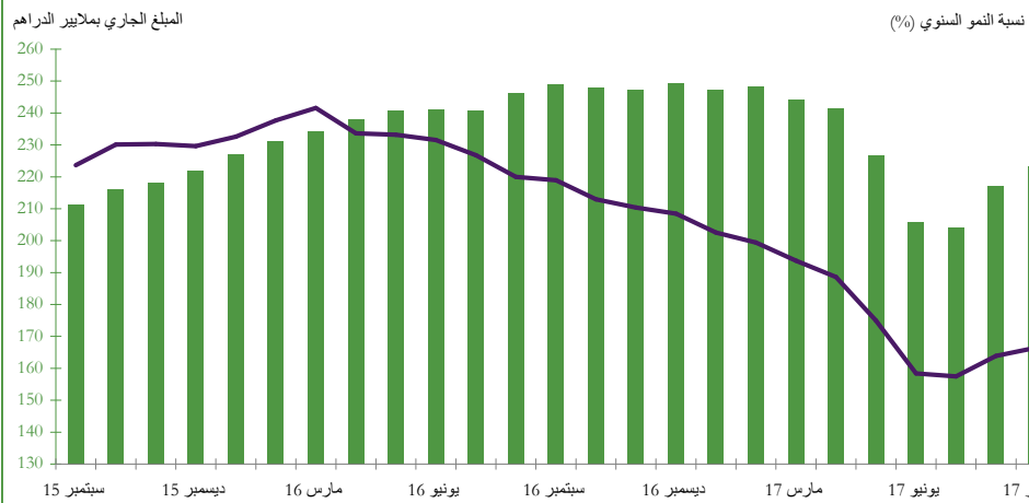
الرسم البياني 3: تطور صافي الاحتياطات الدولية